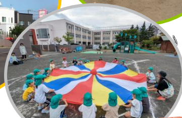
園庭で行う運動会